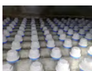
Düsenboden nach DIN 19643/ÖNORM 6216